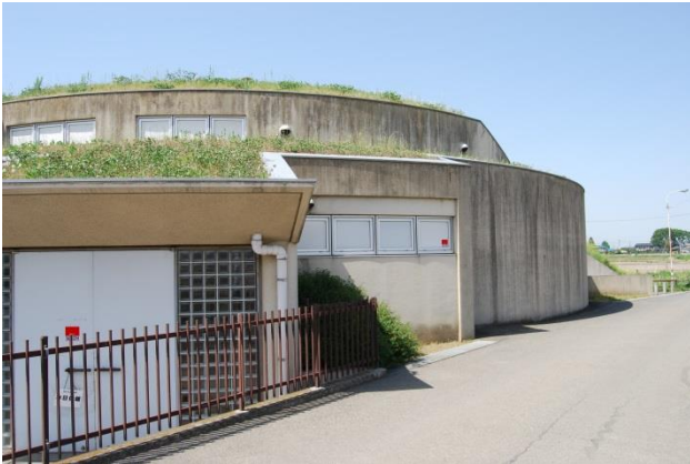
改修前の展示館外観