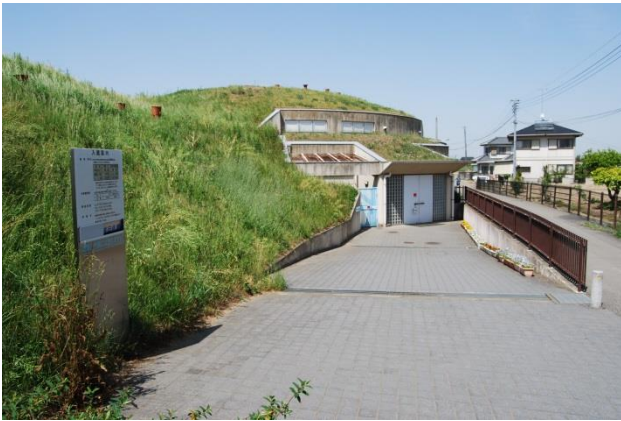
改修前の展示館入口