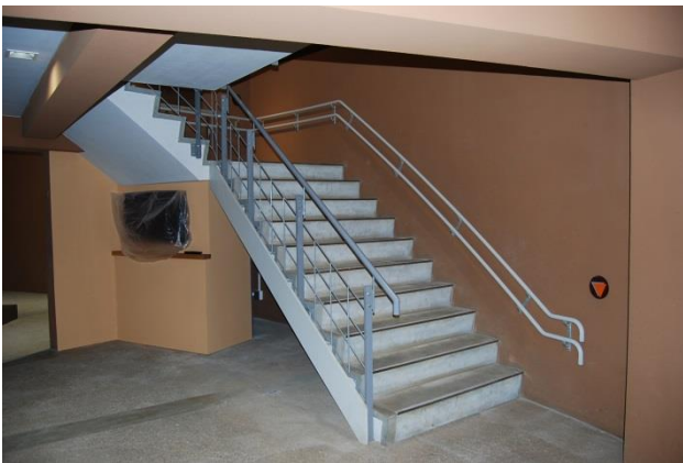
改修後（階段壁面に手摺りを新設）