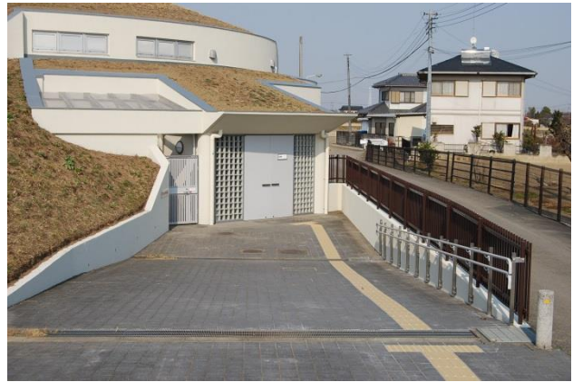
改修後（手摺り・誘導ブロックを新設）