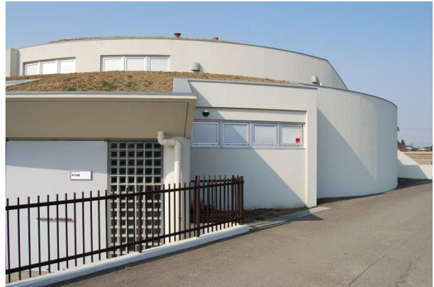
改修後（外壁の塗替えを施工）